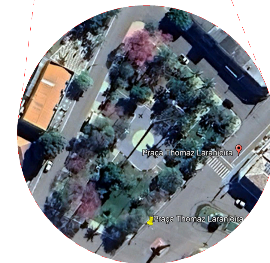
LOCALIZAÇÃO 1 : 200