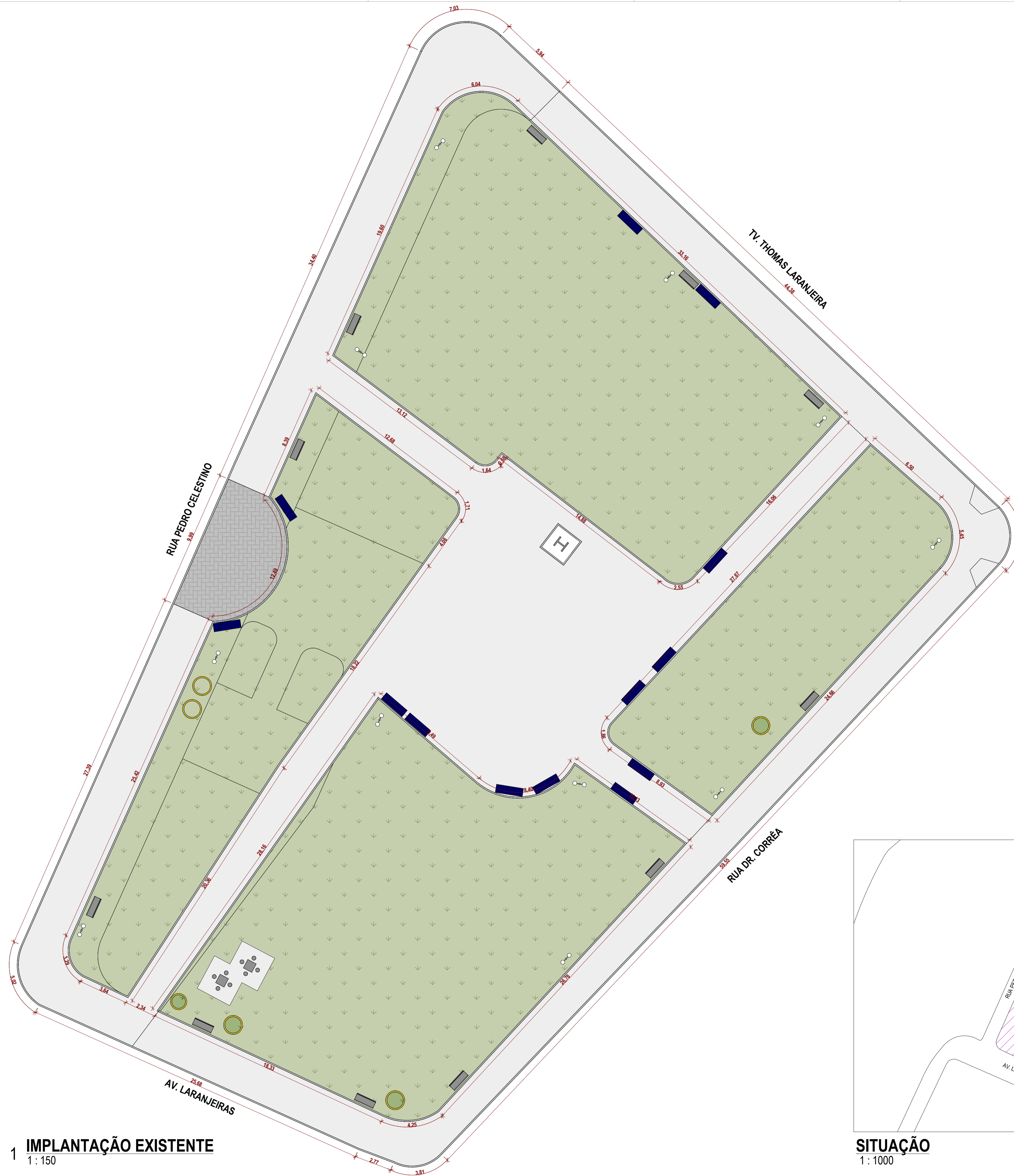
1 IMPLANTAÇÃO EXISTENTE 1 : 150